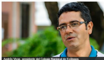
Andrés Vivas, presidente del Colegio Nacional de Ecólogos.

Publicado en: lun, 20 nov 2017 08:20:00 -0500